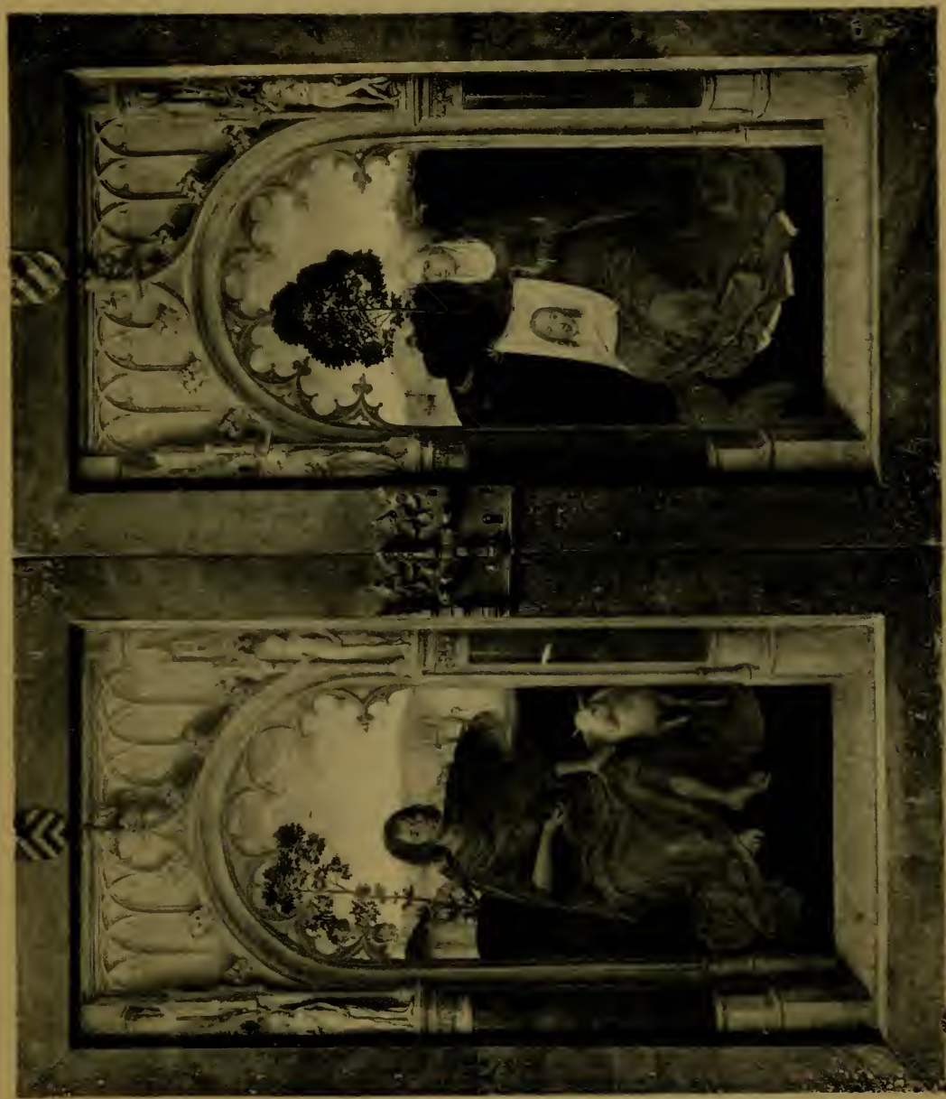
Saint Jean Baptiste & Sainte Véronique Revers des volets du triptyque « L'Adoration des Mages ».